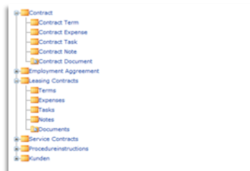
Abbildung 1 – Eine von vielen möglichen Ablagestrukturen mit ECSpand

Abteilungen anfertigen müssen, bietet Ihnen eine elektronische Vertragsakte mehrere Sichten und Ordnungskriterien, so dass verschiedene Abteilungen und Sachbearbeiter die Vertragsinformationen nach den für sie relevanten Suchkriterien wiederfinden. Während z.B. die Buchhaltung Kundenverträge über Debitorenummern verwaltet, sucht ein Vertriebsmitarbeiter möglicherweise bezogen auf eine bestimmte Region oder ein PLZ-Gebiet.