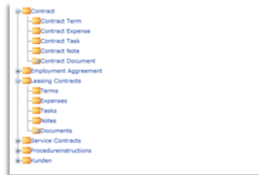
Abbildung 1 – Eine von vielen möglichen Ablagestrukturen mit ECSpand

Abteilungen anfertigen müssen, bietet Ihnen eine elektronische Vertragsakte mehrere Sichten und Ordnungskriterien, so dass verschiedene Abteilungen und Sachbearbeiter die Vertragsinformationen nach den für sie relevanten Suchkriterien wiederfinden. Während z.B. die Buchhaltung Kundenverträge über Debitorenummern verwaltet, sucht ein Vertriebsmitarbeiter möglicherweise bezogen auf eine bestimmte Region oder ein PLZ-Gebiet.